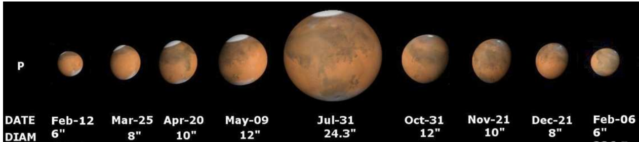
Abb. 2 Durchmesser des Roten Planeten während des Marsjahrs 2018.

Der Planet Mars ist im Zeitraum Anfang Juli bis Mitte September das hellste Objekt der Sommernächte, heller als der Riesenplanet Jupiter – ausgenommen ist der Planet Venus , der am Abend jedoch relativ schnell untergeht. Die Erdnähe wird erst am 31. Juli erreicht; dies hängt mit der Exzentrizität der Marsbahn zu tun. Am 5. September beträgt die Marshelligkeit nur noch -2 mag , am 14. Oktober nur rund -1 mag und Anfang Dezember bereits etwa 0 mag .