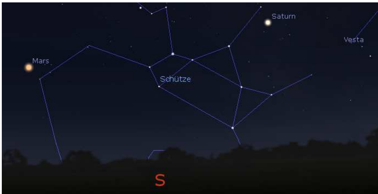
Abb. 7 Marsposition am 28. August.

Einen Monat nach seiner Oppositionsstellung befindet sich der Planet Mars bereits gegen 22:00 Uhr relativ hoch über dem Südhorizont. Nach seiner Opposition befindet er sich bereits im Sternbild Schütze (Sgr), wo weiter westlich der Planet Saturn und der Kleinplanet Vesta leuchten, allerdings erheblich lichtschwächer als unser Nachbarplanet.