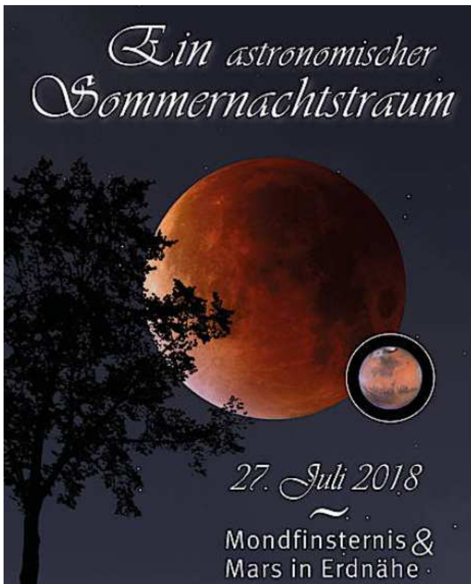
Abb. 10 Ankündigung des 2. Teils des Astronomietags im Jahr 2018.

Bei gutem Wetter beobachten wir sowohl den Roten Planeten als auch den verfinsterten Mond, der an diesem Abend bereits verfinstert aufgehen wird. Weitere Details finden Sie unter www.ig-hutzi-spechtler.eu .