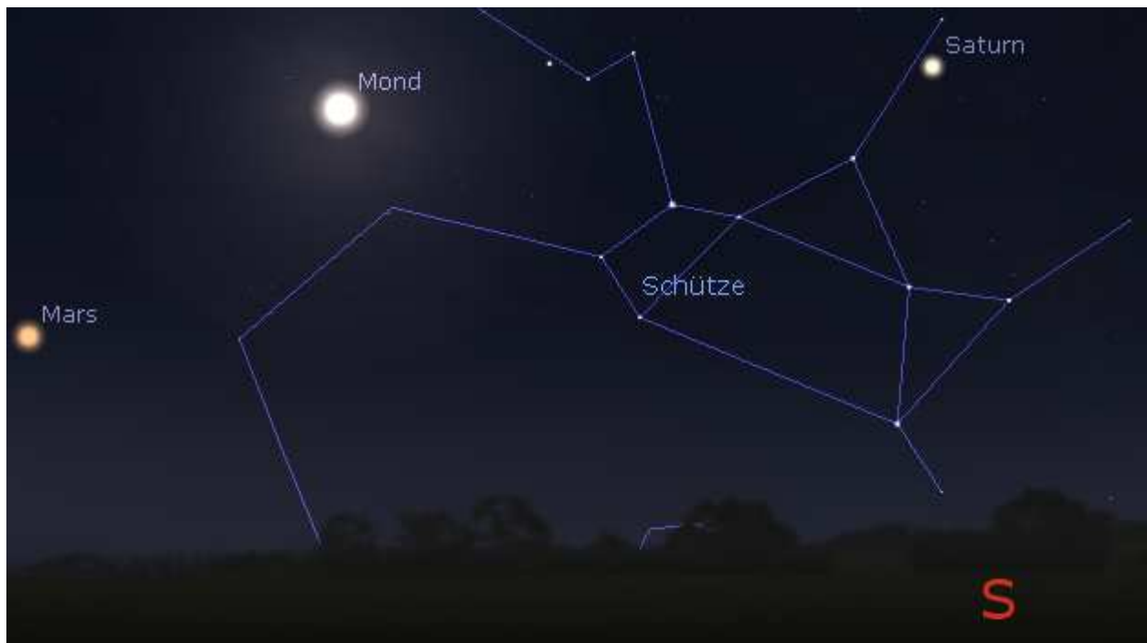
Abb. 5 Marsposition am 26. Juli.

In dieser Nacht befinden sich beide Planeten gegen 23:15 Uhr am Südhimmel; der Rote Planet wandert weiter aus dem Sternbild Steinbock (Cap) in Richtung des Sternbilds Schütze (Sgr). In dieser Nacht gesellt sich der fast volle Mond zu den Planeten. In der darauffolgenden Nacht wandert er während der Totalen Mondfinsternis in den Erdschatten. Eine gute Gelegenheit sich die Helligkeiten der unterschiedlichen Objekte nochmals zu veranschaulichen.