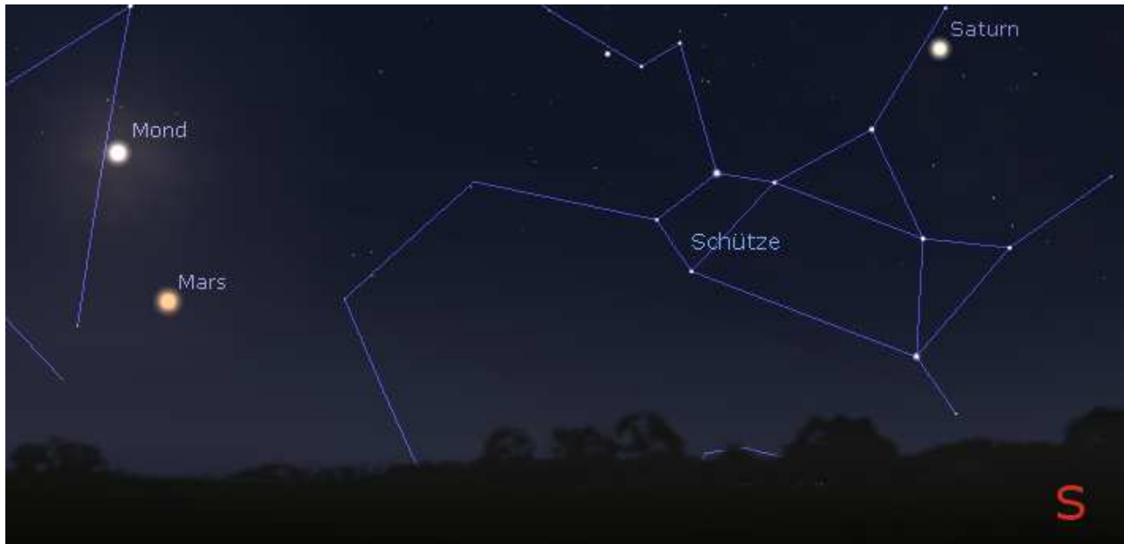
Abb. 6 Marsposition am 27. Juli.

Gegen 23:00 Uhr ergibt sich ein seltener Himmelsanblick: der helle Vollmond stiehlt den beiden Planeten Mars und Saturn für einige Stunden die Show, bevor er aus dem Erdschatten austritt (Totale Mondfinsternis) und die weitere nächtliche Beobachtung mit seinem hellen Licht erschwert. In dieser Nacht kommt uns der Rote Planet am nächsten (Marsopposition).