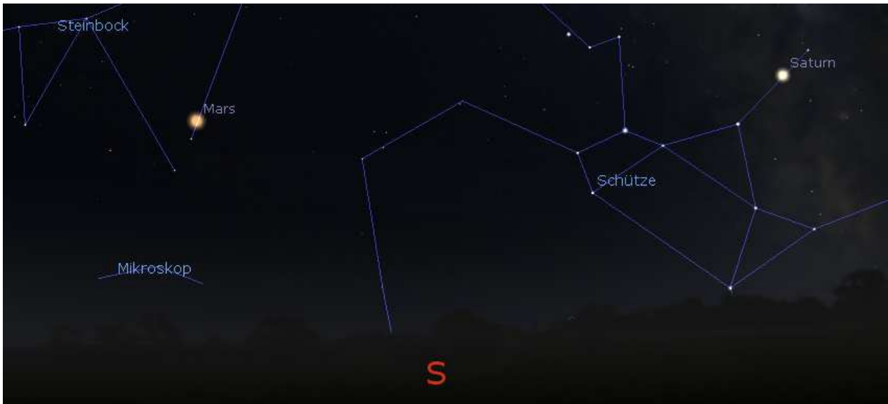
Abb. 4 Marsposition am 15. Juli.

In dieser Nacht befinden sich beide Planeten gegen 01:40 Uhr am Südhimmel; der Rote Planet ist bereits teilweise aus dem Sternbild Steinbock (Cap) herausgewandert. Saturn weilt weiterhin im Sternbild Schütze (Sgr). Leider steigt der Rote Planet während der Opposition nicht sehr hoch über den Horizont.