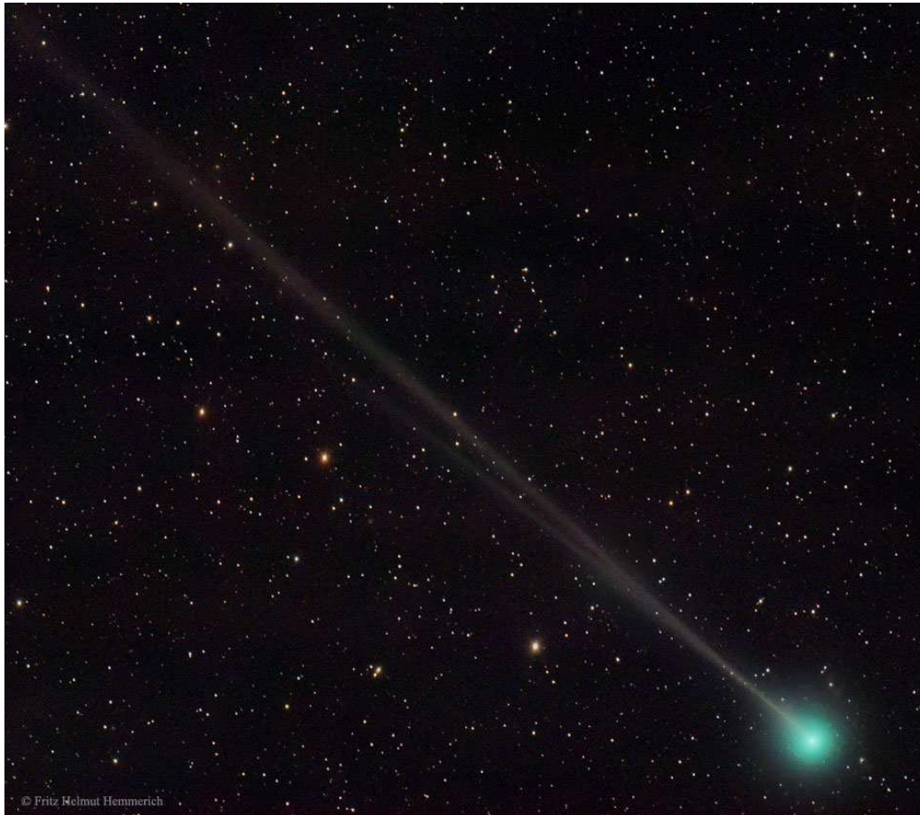
Abb. 2 Der Komet 45P Ende Dezember 2016.

Bei der Beobachtung des Kometen mit dem Teleskop zeigt sich eine verwaschene runde Koma , die ein sternartiges Zentrum umgibt und möglicherweise – abhängig von der Öffnung des Teleskops sowie den Beobachtungsbedingungen – ein Kometenschweif in Richtung Osten. Auf länger belichteten Aufnahmen zeigt sich bereits ein Schweif mit einer Länge von rund 3 Grad , der eine aquamarine Koma umgibt (Abb. 2).